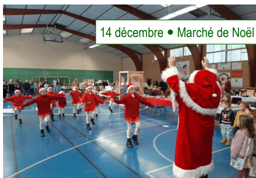
14 décembre • Marché de Noël

L'association des parents d'élèves a brillamment réussi son loto, qui s'est tenu dans une ambiance chaleureuse et enthousiaste. Parents, enfants, habitants du village et partenaires locaux ont répondu présents, remplissant la salle et créant une atmosphère conviviale. Les bénéfices récoltés permettront de soutenir les projets pédagogiques de l'école.