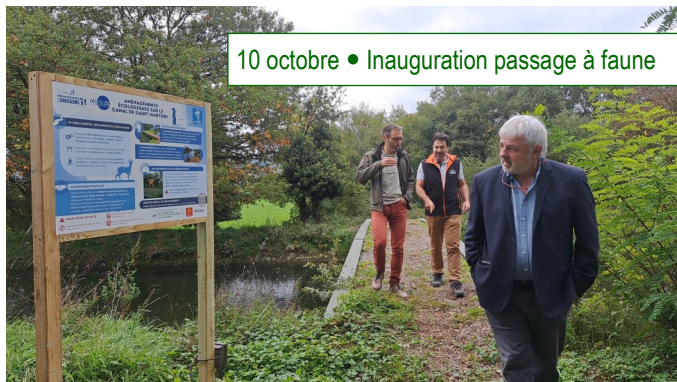
10 octobre • Inauguration passage à faune