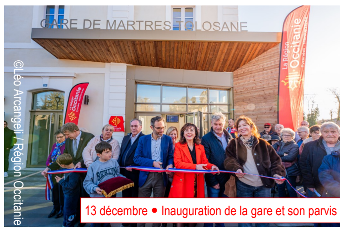
13 décembre • Inauguration de la gare et son parvis

Grâce à l'engagement des bénévoles, à l'organisation impeccable et à la générosité des participants, cette édition a été un véritable succès. Les nombreux lots ont fait le bonheur des gagnants, tandis que la buvette et les pâtisseries maison ont permis de prolonger le plaisir du partage.