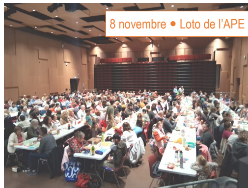
8 novembre • Loto de l'APE