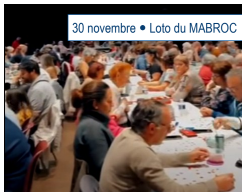
30 novembre • Loto du MABROC