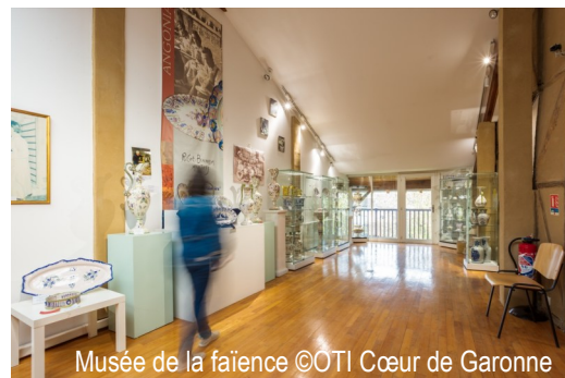
Musée de la faïence

Cette année 2026 promet donc d'être un temps fort pour notre musée, à la fois festif et fédérateur.