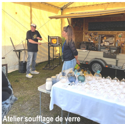
Atelier soufflage de verre