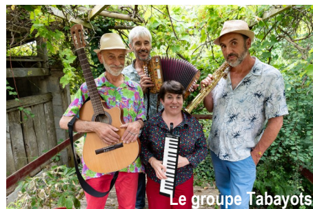
Le groupe Tabayots

15h : Bal trad avec le groupe " Tabayots ".